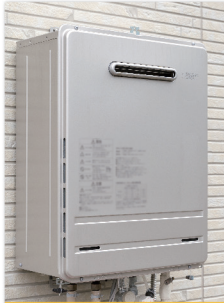
給湯器/エコキュート