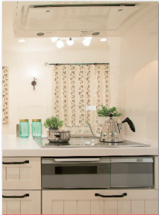
システムキッチン※

次のとおりです。なお、エアコンは、オプションの申込みがある場合に対象機器に含めることができます。